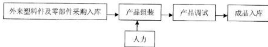
图3.1.2-3 防雷产品工艺流程图