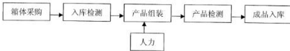
图 3.1.2-1 成套电气设备工艺流程图